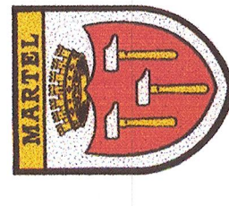
Schéma communal d'assainissement

DESIGN - PRESCRPTION 10 DEC. 2007 DE GOURDON